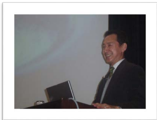
宇宙飛行士 毛利衛氏(1970年 化学科卒) 講演会